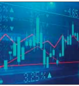
आर्थिक आंकड़े, वैश्विक रुझान से तय करेंगे बाजार की दिशा